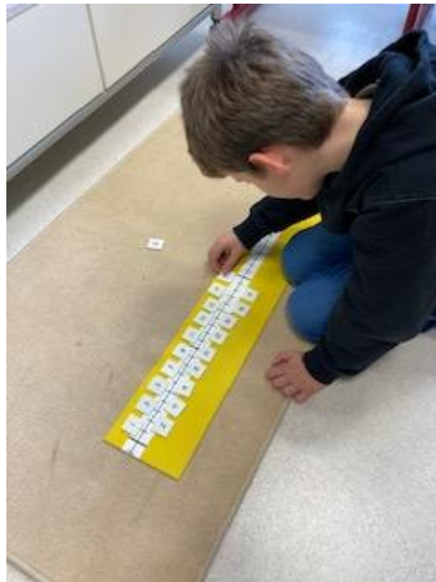
Zahlenstrahl – Zahlen bis 20 zuordnen