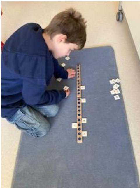
Zahlenreihe 20 – Zahlen zuordnen