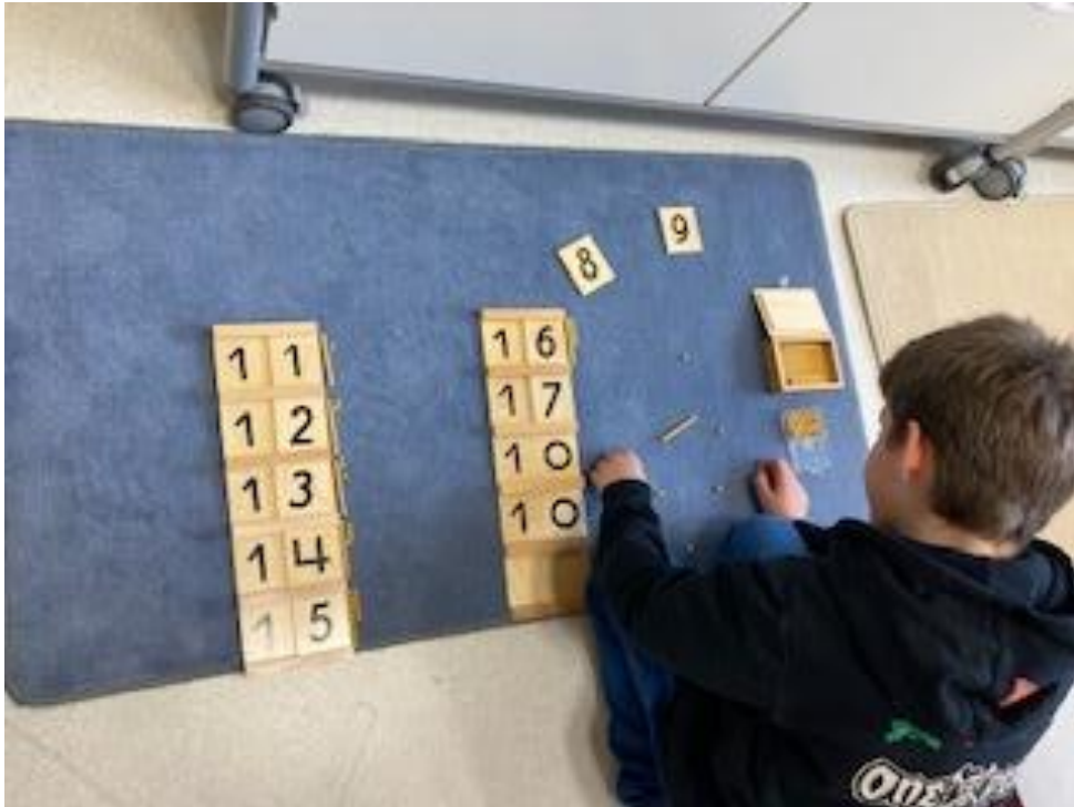
Zahlen bis 20 erarbeiten – mit den Seguintafeln