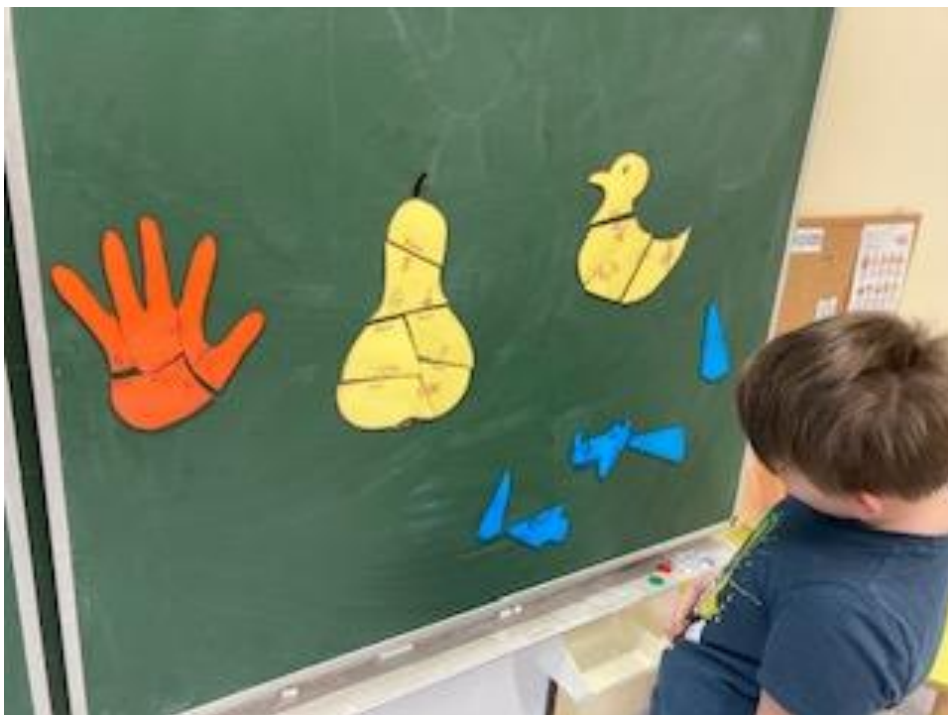
Lesetraining – Wort / Bild zuordnen