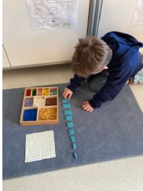
Malreihen– Perlenstäbchen zur Multiplikation